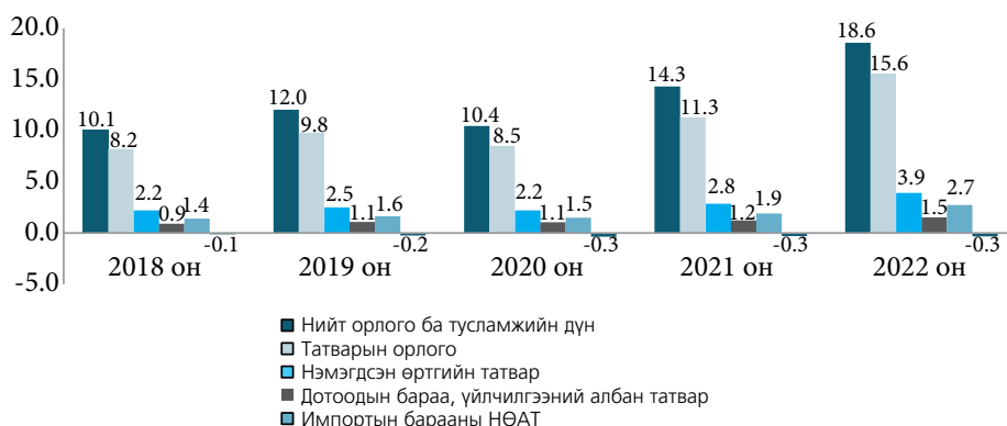
График 1. Нэгдсэн төсөв дэх татварын орлого ба НӨАТ-ын орлогын бүтэц (их наяд төгрөгөөр)

Улсын төсвийн орлогын бүтцэд эзлэх импортын НӨАТ-ын хувь, хэмжээ өндөр байгаа нь манай улс импортоос өндөр хамааралтай болохыг давхар илтгэж байна (График 2).